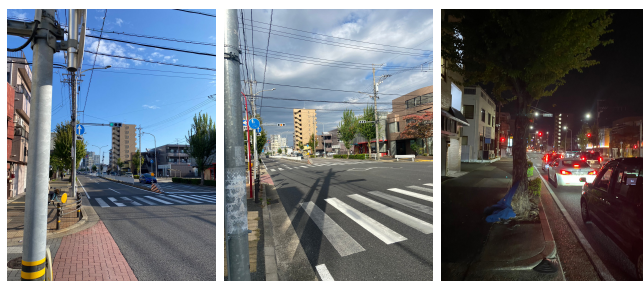
図 1 撮影した信号機の例 (左 : 8 時 -10m, 中 : 14 時 0m, 右 : 20 時 18m)

また、大量の画像を容易に得るために、コントラストの調整やノイズを付与するなどのデータ拡張を行った。