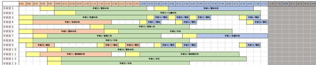
図 2 手術スケジュール

表 1, 表 2, 表 3 より (I), (II), (III) はすべて適切な結果であった。よって、本研究の目標である、手術スケジューリングと麻酔科医・看護師の割当を同時に行うことができた。