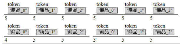
図1 在庫列のトレース

[nil, nil, mk_出力型(mk_token("商品_0"), nil), mk_出力型(mk_token("商品_0"), 0)]