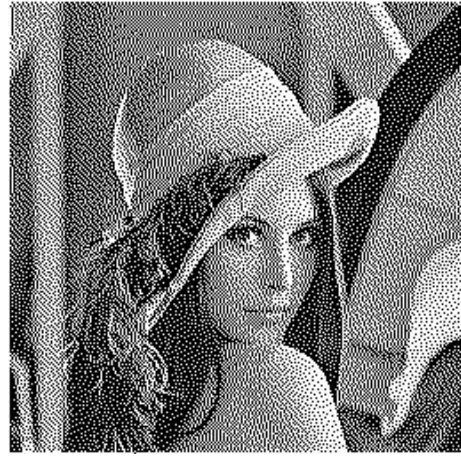
図4 提案手法による誤差拡散法画像