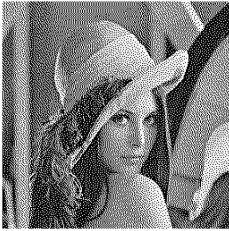
図3 Floyd-Steinberg 法による誤差拡散画像