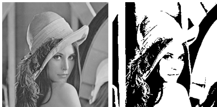
図 1 左：濃淡画像 右：単純2値化画像

ここでは、誤差拡散法の中でも代表的な Floyd-Steinberg 法を考える [2]。Floyd-Steinberg 法では図 2 のような拡散係数を用いて、注目ピクセルで発生した誤差を拡散させる。すなわち、変換前の画像を u(i, j) 、変換後の画像を v(i, j) とするとき、注目ピクセルが (i, j) であるとするとき、まず式 (1) によって v(i, j) を定める。次に注目ピクセル (i, j)